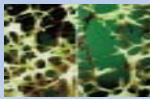
Sujet jeune Sujet ostéoprotique

La mesure du contenu minéral osseux, c'est-à-dire de la densité des os en calcium, donne un reflet relativement fidèle de la solidité osseuse.